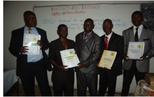
Soutenance de rapport de stage devant le Jury