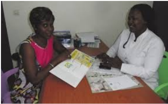
Stage d'un apprenant sur le terrain.