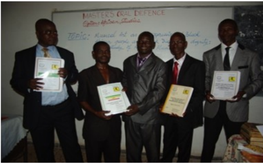
Soutenance de rapport de stage devant le Jury